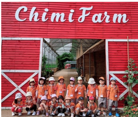
Lớp Lilies – Chuyến dã ngoại tại Chimi Farm.