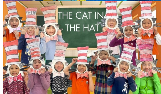
Các hoạt động về chủ đề Rau củ

Học sinh lớp Sunflowers đã lấy nhiều hạt giống từ cà chua bi và đậu tây rồi thử nghiệm các phương pháp trồng khác nhau, bao gồm cả trồng với nước và với đất, để quan sát sự thay đổi trong quá trình phát triển của thực vật.