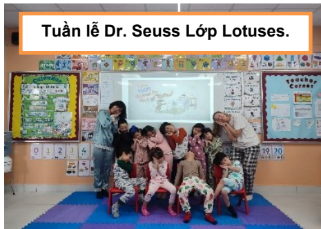
Tuần lễ Dr. Seuss Lớp Lotuses.

Điểm nổi bật trong tháng là những chuyến thăm quan dã ngoại thú vị. Mỗi lớp đã đến thăm các địa điểm khác nhau, chẳng hạn như Chimi Farm, Erahouse, My Little Gym và The Creative Gara. Những chuyến đi này mang lại những trải nghiệm học tập độc đáo và tất cả học sinh đều có khoảng thời gian thật sự vui vẻ.