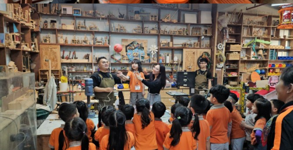
Học sinh lớp Lavenders đã có trải nghiệm tuyệt vời tại Creative Gara.