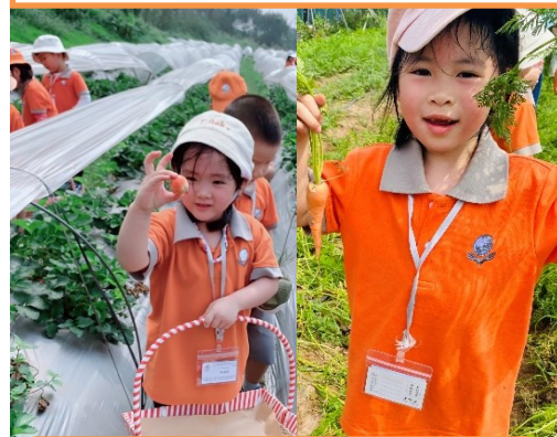
Nhà Tiên lớp Sunflowers thu hoạch cà rốt tại Chimi Farm.