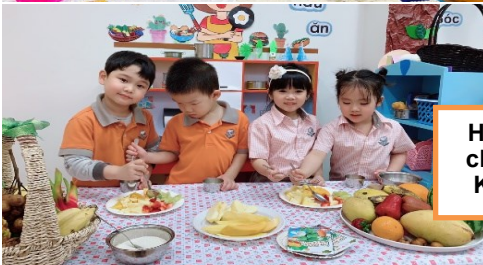
Hoạt động chủ đề lớp K1 và K2.