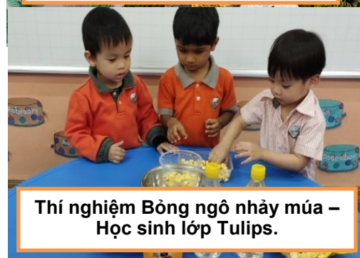
Thí nghiệm Bồng ngô nhảy múa – Học sinh lớp Tulips.