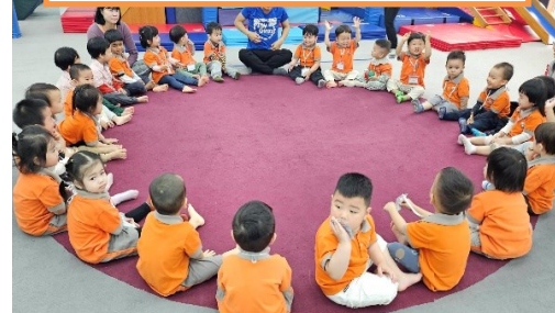
Học sinh lớp Roses và Tulips tại My Little Gym.

Các em học sinh lớp Daisies hào hứng tự trồng hoa, tìm hiểu về các bộ phận của hoa và quá trình quang hợp. Các em nhận trách nhiệm với việc tưới nước và chăm sóc hoa, phát triển tinh thần đồng đội và tinh thần chủ động.