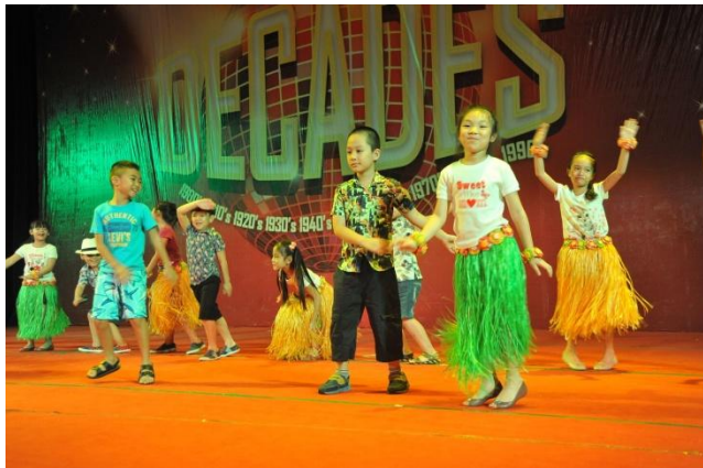
Một tiết mục biểu diễn của học sinh trong chương trình Văn nghệ cuối năm