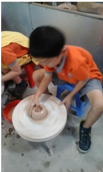
Học sinh lớp 3 thử sức làm bình trên bàn xoay