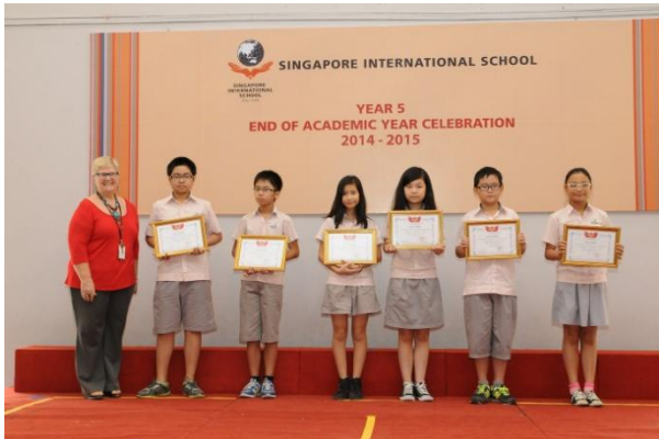
Trao giấy khen cho học sinh đạt thành tích xuất sắc trong Lễ ra trường