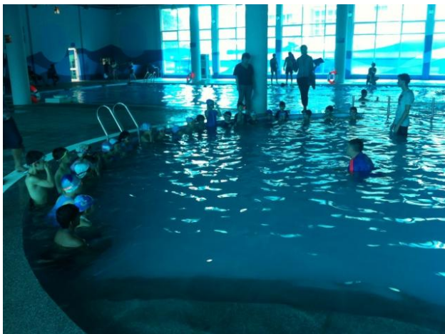
Học sinh trong giờ học bơi