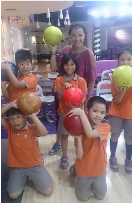
Học sinh khối 3 tại trung tâm Bowling