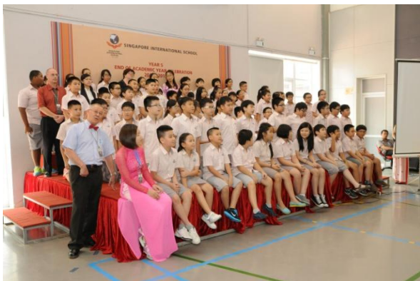
Học sinh Khối 5 biểu diễn trong Lễ ra trường