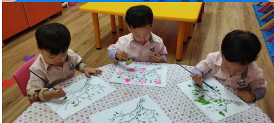
Học sinh lớp Nursery vẽ hoa đào.