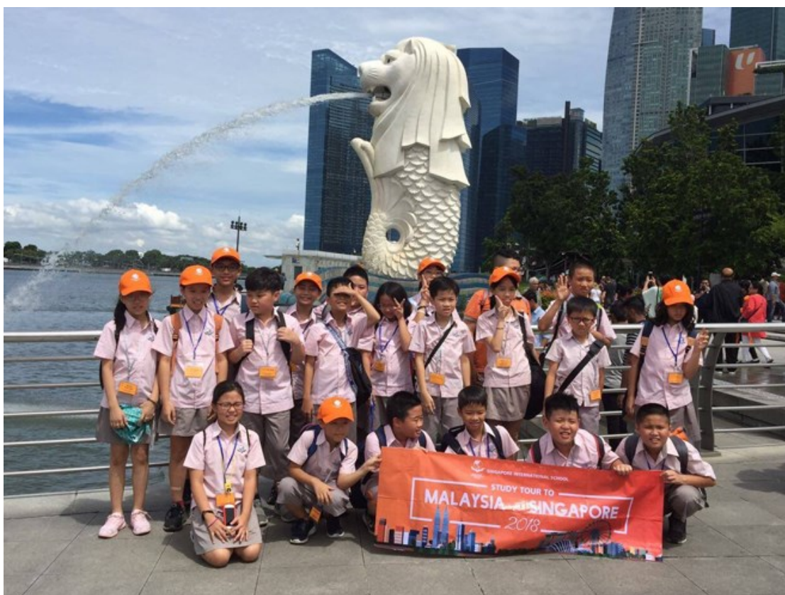
Hình ảnh học sinh tham gia chương trình Du học hè 2018 tại Malaysia và Singapore.