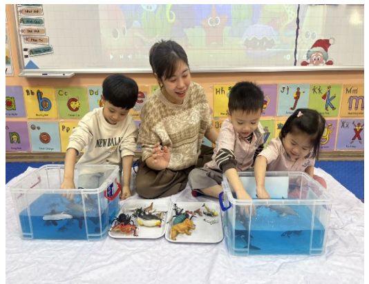
Chủ đề học tập - Động vật Đại dương

Trong các bài học ngôn ngữ, các em học sinh tham gia đặt tên và thảo luận về các loài động vật biển khác nhau. Học sinh tham gia hoạt động chọn các loài động vật biển và thả chúng xuống nước.