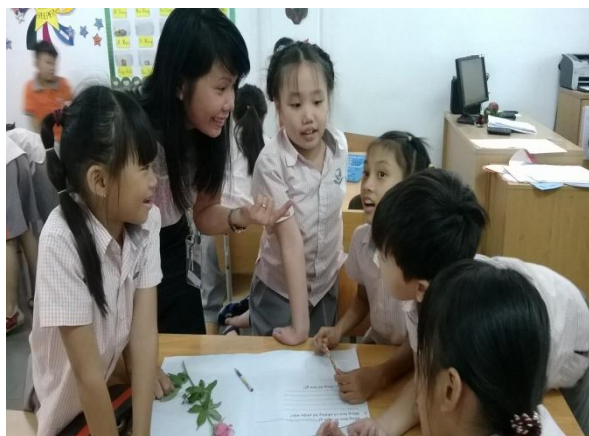
Học sinh và giáo viên trong buổi thảo luận nhóm