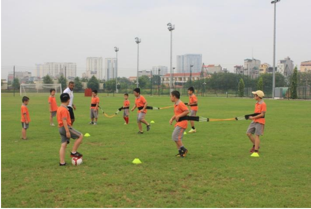
Đội bóng SIS tham gia buổi tập huấn với các cầu thủ chuyên nghiệp của Brazil

Các cầu thủ Brazil đã trình diễn các kỹ năng cá nhân và truyền đạt cho các em những điểm mạnh của bóng đá Brazil. Tất cả học sinh tham gia buổi huấn luyện đã được trao giấy chứng nhận để ghi nhận việc các em đã tham gia buổi huấn luyện cùng các cầu thủ Brazil. Bắt đầu từ tháng sau, Trường học Bóng đá Brazil sẽ được mở vào các ngày cuối tuần cho tất cả các em học sinh. Chúng tôi sẽ sớm cập nhật tới Quý vị và các em thông tin về chương trình này.