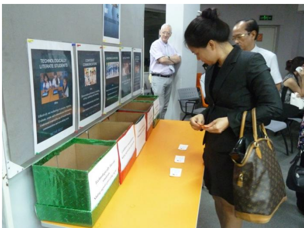
Phụ huynh tham gia cuộc khảo sát về mức độ quan trọng của các mục tiêu học tập