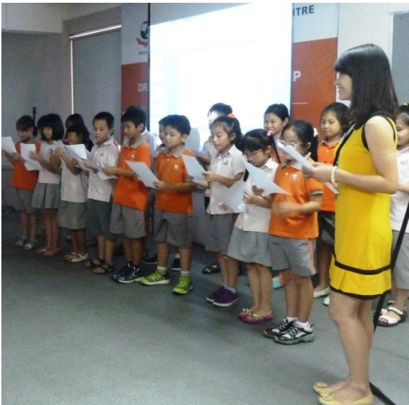
Học sinh lớp 3D thể hiện một ca khúc về những mục tiêu học tập