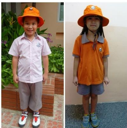
Đồng phục trường