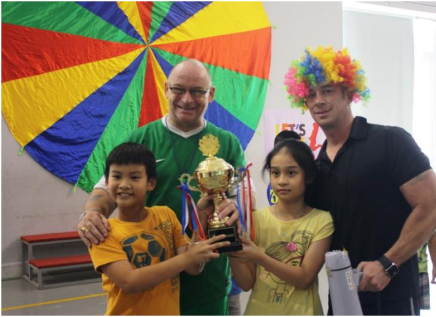
Đội Vàng giành chiến thắng trong Ngày hội Thể thao