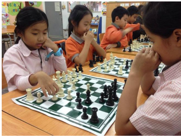
Câu lạc bộ Cờ