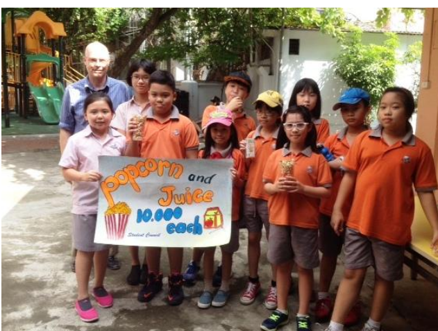
Hội học sinh trong hoạt động bán bỏng ngô gây quỹ từ thiện