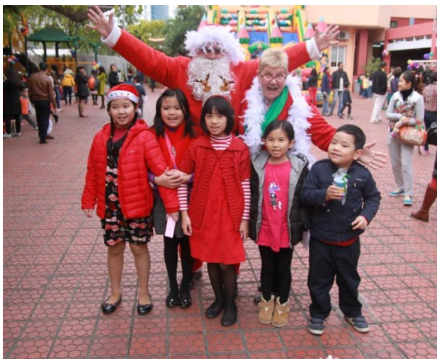
Hội chợ Giáng sinh 2014