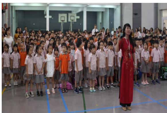
Buổi sinh hoạt đầu tuần

Bảng thông tin này cũng giúp phụ huynh lên kế hoạch cho kỳ nghỉ để không ảnh hưởng tới các kỳ kiểm tra. Học sinh sẽ có bài kiểm tra học kỳ 1 ngay khi các em quay lại trường sau kỳ nghỉ Giáng sinh.