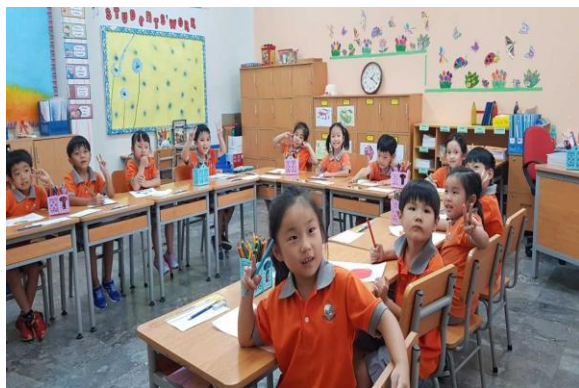
Học sinh Lớp 1