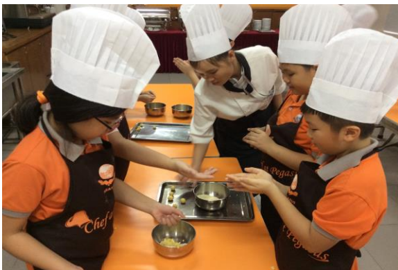
Hoạt động dã ngoại tại Trung tâm Đào tạo Quốc tế Pegasus

Các Câu lạc bộ đã bắt đầu đi vào hoạt động với những hoạt động được yêu thích như: Nấu ăn, Cầu lông, Bóng đá và Cờ vua. Ngoài ra, câu lạc bộ Robot Huna cũng được các em rất yêu thích vì các em được học kỹ năng tư duy logic và lắp ráp robot.