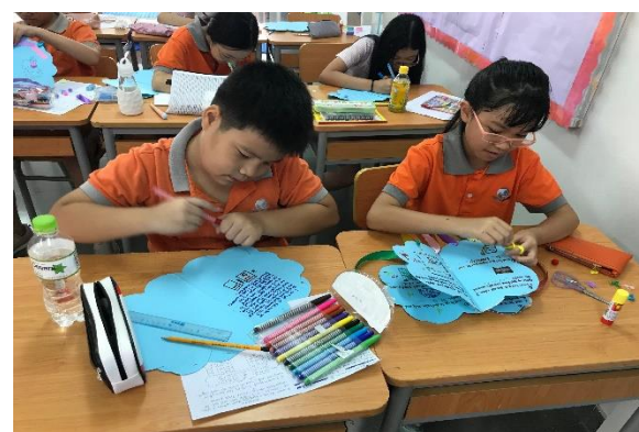
Giờ học Thủ công – Nghệ thuật