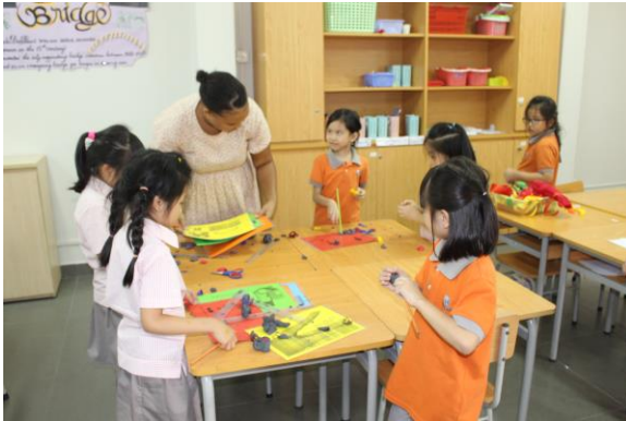
Lớp học tự khám phá