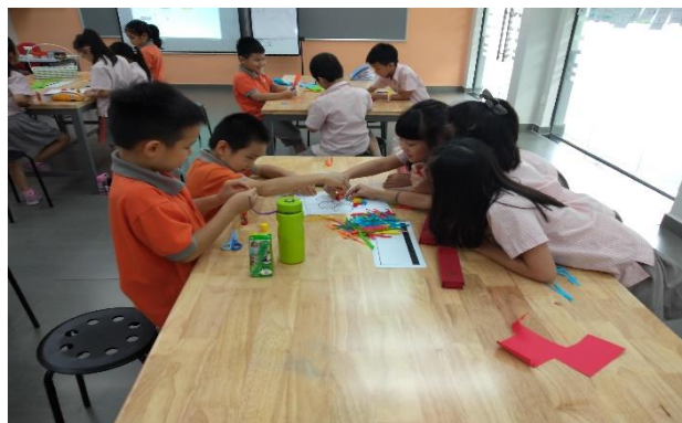
Lớp học Khám phá – Gấp giấy nghệ thuật

Các câu lạc bộ sau giờ học đã được triển khai với các hoạt động được đồng ý các em học sinh yêu thích như nấu ăn, cầu lông, bóng rổ, bóng đá, cờ vua. Năm nay, Nhà trường cũng đưa vào một số các hoạt động mới như Origami, câu lạc bộ Sách và câu lạc bộ STEM nơi học sinh có thể khám phá nhiều thử nghiệm sáng tạo sử dụng các nguyên liệu STEM.