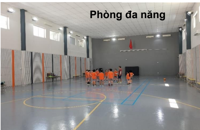
Phòng đa năng