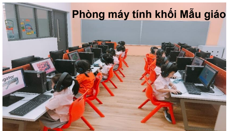
Phòng máy tính khối Mẫu giáo