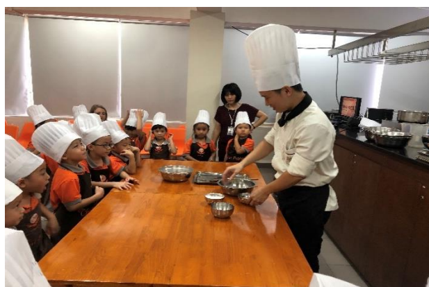
Lớp học nấu ăn tại Pegasus